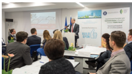
Luca Bertalot, generální tajemník Evropské hypoteční federace podporující program Zelená hypotéka a prezentující se na workshopu „Změna financování, změna financování“.

Zelená hypotéka je poskytována prostřednictvím konsorcia mezi zúčastněnou bankou, realitním investorem / developerem, který souhlasí se splněním kritérií programu.