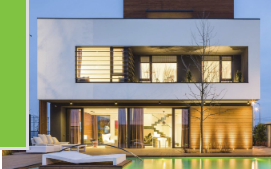
PRVNÍ ŠETRNÁ BUDOVA PROJEKTU V RUMUNSKÉ BUKUREŠTI, CERTIFIKOVANÁ PROJEKTEM ROGBC GREEN HOMES, BUDOVA AMBER GARDENS (ALESONOR)

Podpora výstavby šetrných budov prostřednictvím důvěryhodného, nákladově efektivního certifikačního programu představuje příležitost pro rezidenční investory a developery rozlišit kvalitu a environmentální aspekty jejich stavebních projektů a zároveň vzdělávat spotřebitele o finančních a jiných výhodách. Finanční instituce – poskytováním zelených hypoték vázaných na certifikované šetrné budovy – mohou výrazně snížit riziko hypotečního selhání a zvýšit oceňování aktiv domů, které financují, a proto mohou nabízet nižší náklady na financování. Nižší finanční náklady poskytují kupcům nemovitostí větší kupní sílu investovat do zlepšené kvality výstavby, protože zelená hypotéka má ocenit významné snížení nákladů na energii, opravy a zdraví těch, kteří šetrné budovy kupují. Zelené hypotéky rovněž mohou pomoci trhu lépe ocenit přidanou hodnotu takové půjčky tak, aby mohl správně investovat na začátku.